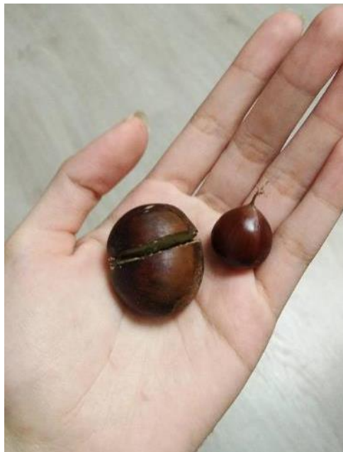
ขนาดต่างกันเลย...