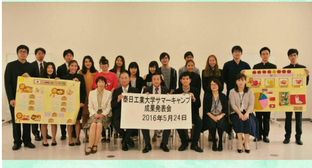
ภาพถ่ายรวมหลังจากการนำเสนอหัวข้อปิดโครงการ