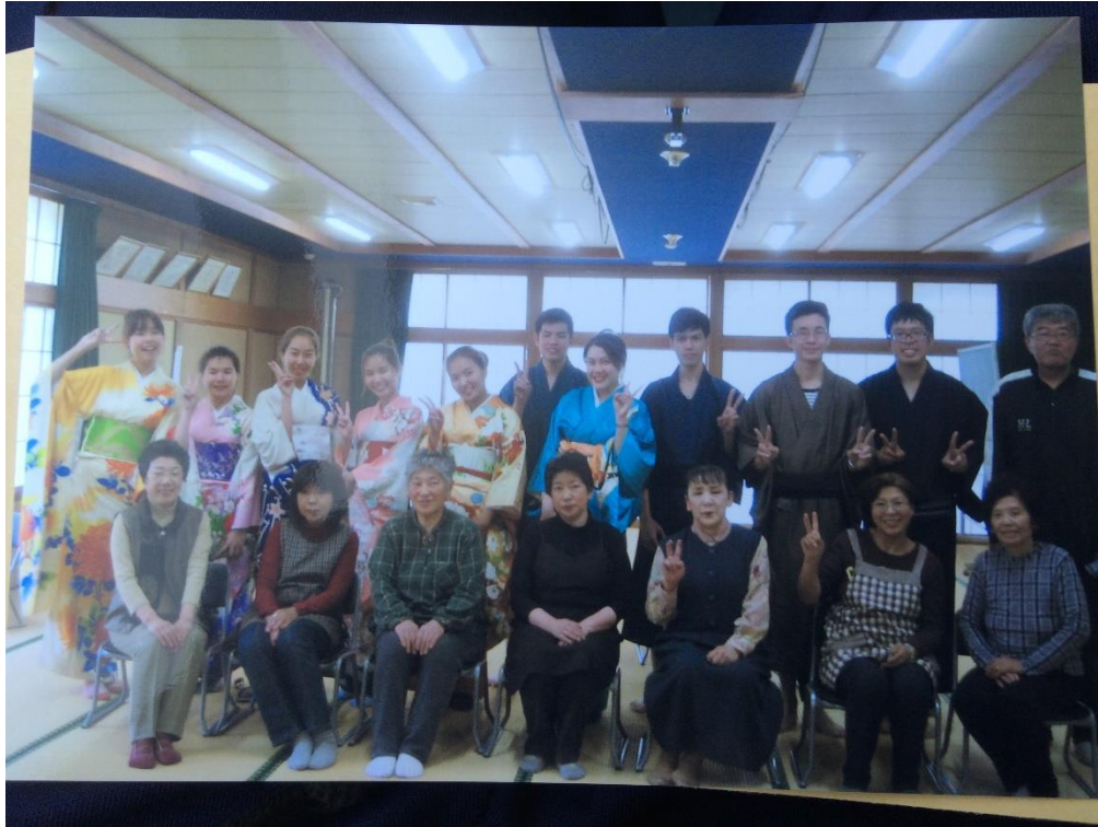
ภาพถ่ายรวมการเข้าร่วมฟาร์มสเตย์กับเกษตรกรชาวญี่ปุ่น