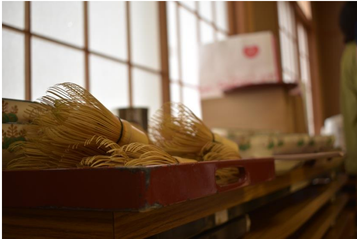
อุปกรณ์ที่ใช้ในการชงชา

กิจกรรมชงชาจะสอนเกี่ยวกับขั้นตอนการชงชา และมารยาทการดื่มชาของคนในสมัยก่อนครับ