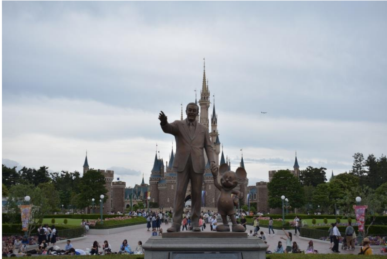
รูปปั้น Walt Disney และ Mickey Mouse โดยมีปราสาทดิสนีย์เป็นพื้นหลัง

การเดินทางไปดิสนีย์แลนด์จะต้องเดินทางไปเองครับ โดยทาง ABK จะให้ตั๋ว E-Ticket มาพร้อมแนะนำการเดินทาง ซึ่ง E-Ticket นี้สามารถเลือกได้ว่าจะเข้าดิสนีย์แลนด์หรือดิสนีย์ซีครับ