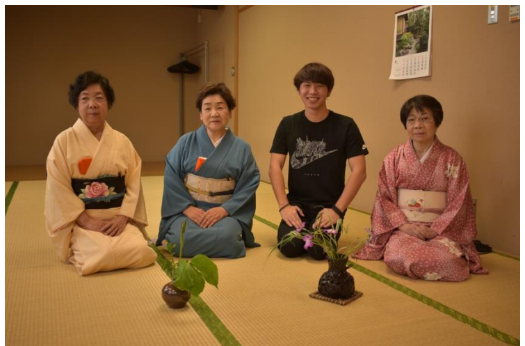
อาจารย์สอนชงชาทั้งสามท่าน