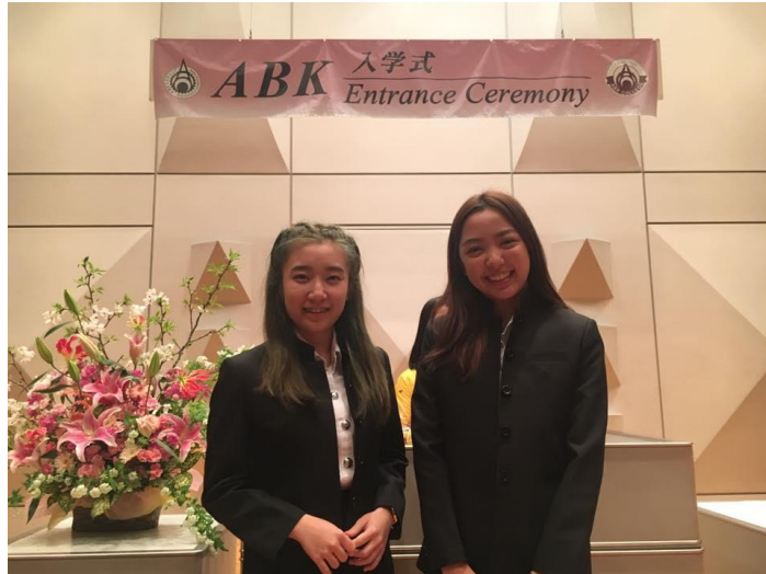
พิธีต้อนรับ

การเรียนภาษาญี่ปุ่นของสถาบัน ABK สำหรับนักเรียน T Class จะเรียนในวันจันทร์ถึงศุกร์ ตั้งแต่ 9:10 น. จนถึง 12:40 น. แบ่งออกเป็น 4 คาบ คาบละ 45 นาที คือ 9:10 - 9:55 , 10:05 – 10:50 , 11:00 – 11.45 และ 11:55 – 12:40 ซึ่งระหว่างคาบเรียนจะมีการพักเบรก 10 นาที เพื่อให้นักเรียนได้พักผ่อน ทำธุระส่วนตัว หรืออ่านทบทวนความรู้ ทำความเข้าใจบทเรียน รูปแบบของการสอนของ ABK มีทั้งฟัง พูด อ่าน เขียน ถึงแม้จะไปเรียนเพียงระยะเวลาสั้นๆ แต่กลับได้รับการพัฒนาอย่างรวดเร็ว นอกจากนี้จะมีการบ้านให้เรา กลับไปฝึกฝนทบทวนบทเรียน และมีสอบย่อยก่อนเริ่มเรียนบทใหม่ทุกครั้ง สิ่งที่น่าสนใจอย่างหนึ่งในการ เรียนที่สถาบัน ABK คือการจัดโต๊ะของนักเรียนเป็นรูปตัว U เพื่อให้อาจารย์สามารถเข้าถึงนักเรียนได้ง่าย และการเปลี่ยนที่นั่งทุกอาทิตย์เพื่อทำความรู้จักกับเพื่อนร่วมห้อง นอกจากนี้จะได้รับความรู้แล้วยังได้รับ มิตรภาพจากเพื่อนมากมาย เนื้อหาการเรียนของนักเรียน T Class จะอยู่ในระดับการสอบวัดระดับ ความสามารถทางภาษาญี่ปุ่นระดับ N4 ( Japanese Language Proficiency Test: JLPT ) มีทั้งการฝึกพูด ประโยคสนทนา การฝึกแต่งประโยคให้สอดคล้องกับสิ่งที่เรียน การสร้างสถานการณ์จำลองต่างๆเพื่อให้ เข้าใจมากขึ้น ฝึกการนำไปใช้ ในทุกอาทิตย์จะให้นักเรียนฝึกแต่งประโยคเพื่อออกไปพูดหน้าห้อง เป็นการ ฝึกพูดหน้าห้องและการนำไวยากรณ์ที่เรียนมานำไปใช้จริง เช่น การพูดเกี่ยวกับอาหารไทย บุคคลที่มี ชื่อเสียง สถานที่ท่องเที่ยวในไทย และวันสำคัญของไทย เป็นต้น