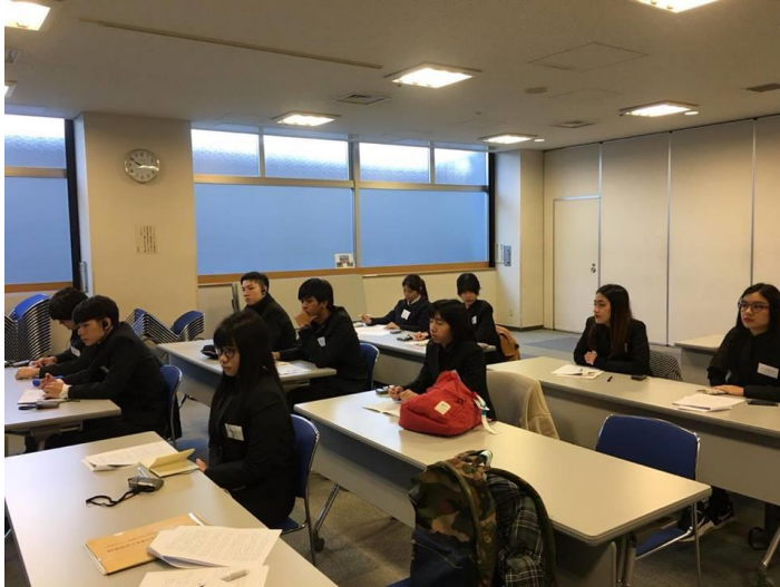
(ภาพบรรยากาศในห้องเลคเชอร์)

วันนี้ตั้งแต่เช้าไปฟังเลคเชอร์ซึ่งเกี่ยวกับอุตสาหกรรมอนิเมะของประเทศญี่ปุ่น