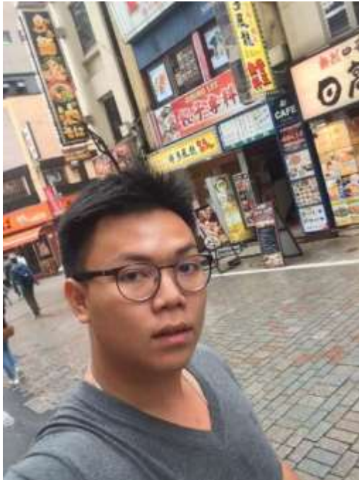
จุดนัดพบ