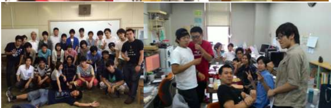
ภาพถ่ายกับเพื่อนๆในห้องเรียน ที่ Osaka Prefecture University College of Technology