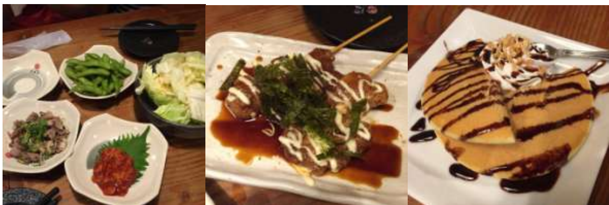
ภาพอาหารจากร้าน Izakaya เป็นพวก Yakitori ปั่นจักรยานจาก I-Wing Nakamozu ประมาณ 5 นาที