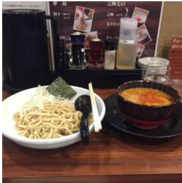
ภาพนี้เป็นภาพ tsukemen ร้านใกล้กับสถานี Nakamozuค่ะ อร่อยมาก!!!

ค่าใช้จ่ายในชีวิตประจำวันนั้น สำหรับตัวดิฉันเอง ส่วนใหญ่ทำอาหารกินเอง เฉพาะค่ากินจึงเฉลี่ยตกอยู่ที่ 1,000 เยนต่อวัน แนะนำให้นำนมมาทำ หรือเครื่องปรุงของไทยติดกระเป๋าไปด้วย เพราะจากประสบการณ์ อยู่ไปสักพักอาจจะอยากกินอาหารไทยค่ะ ☺จะมีค่าเดินทางไป-กลับเพื่อเรียนที่โรงเรียนเทคนิค สัปดาห์ละครั้ง ในช่วงประมาณ 2-3 เดือนแรก ครั้งละประมาณ 1,200 เยนแล้วก็ค่าเดินทางท่องเที่ยวต่างๆ เงินเดือนที่ได้รับจากโครงการ หักค่าหอค่าอินเทอร์เน็ต ค่าประกันสุขภาพที่ต้องจ่าย ถือว่าเหลือเฟือค่ะ ☺