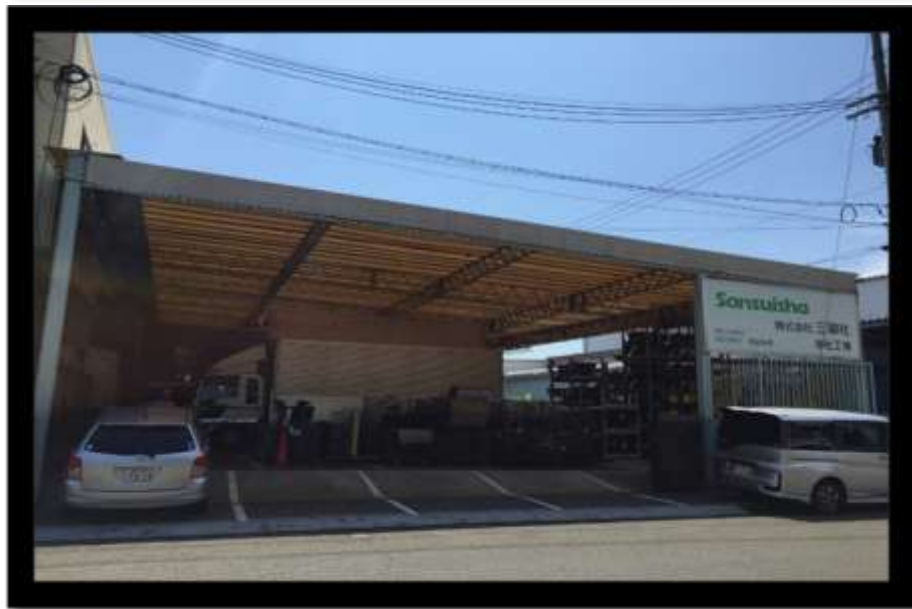
ภาพบริษัท SANSUISHA, OSAKA, JAPAN

โครงการนี้ นอกจากการสหกิจแล้ว ยังได้พัฒนาภาษาญี่ปุ่น เรียนรู้ภาษาท้องถิ่นของจังหวัดโอซาก้า ที่สำคัญมีเพื่อนใหม่มากมาย จะมีกลุ่มๆ หนึ่งชื่อว่ากลุ่ม Orientation จัดขึ้นเพื่อให้นักศึกษาต่างชาติได้เข้าร่วมกิจกรรมต่างๆ ทั้งกินอาหารแลกเปลี่ยนวัฒนธรรม ฝึกภาษา ต่างๆ ดิฉันมีเพื่อนและได้ท่องเที่ยวมากมายจากการเข้าร่วมกลุ่มนี้ค่ะ ถ้าอยากมีเพื่อนเยอะๆ แล้วยังไปเที่ยวแบบไม่ต้องกลัวหลง แนะนำให้เข้ากลุ่มนี้คนในหอพัก I-Wing ส่วนใหญ่ก็เป็นสมาชิกของกลุ่มนี้ หาตัวคนในกลุ่มได้ไม่ยาก ส่วนใหญ่จะชอบมาทำกิจกรรมต่างๆ บริเวณล็อบบี้ของหอพักค่ะ☺