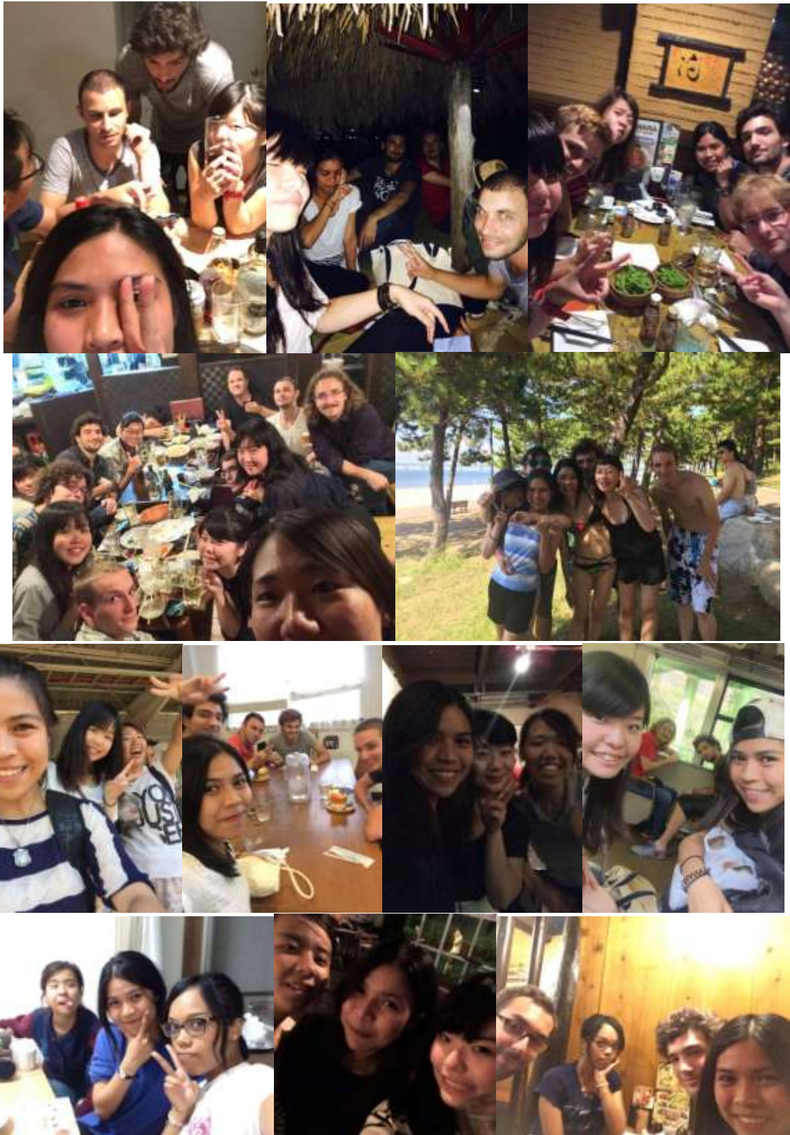
ภาพถ่ายกับเพื่อนๆ กลุ่ม Orientation