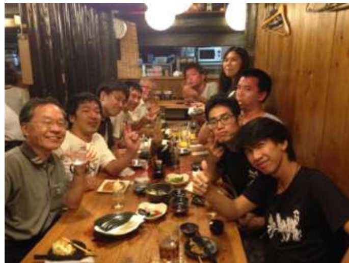
ภาพตอนวัน Bye bye party กับเหล่าบัดดี้และอาจารย์ที่ปรึกษาที่ญี่ปุ่นค่ะ

ที่ Osaka Prefecture University นักศึกษานั้นแต่ละคนจะมีติวเตอร์ (Buddy) เป็นของตัวเองซึ่งเราก็จะมีห้องวิจัย (研究室) เดียวกับบัดดี้แต่เนื่องจากบัดดี้และคนในห้องวิจัยเป็นนักศึกษาระดับปริญญาโทต้องทำวิจัยบรรยายภาคในห้องจึงค่อนข้างเสียจึงไม่ค่อยได้ไปห้องวิจัยบ่อยนัก อีกทั้งไม่มีเวลาไป เนื่องจากการปฏิบัติสหกิจแล้วก็มีกิจกรรมต่างๆด้วยค่ะ