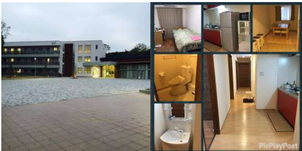
ภาพหอพัก I-Wing Nakamozu

หอที่เราเข้าพักนั้น เป็นหอพักของ Osaka Prefecture University ชื่อว่า I-Wing Nakamozu เนื่องจากเป็นหอพักรวมนานาชาติ มีทั้งคนญี่ปุ่น เวียดนาม จีน เกาหลี ฝรั่งเศส มีทั้งหมด 3 ชั้น ในส่วนของชั้น 1 และ 2 จะเป็นชั้นของผู้ชายซึ่งชั้น 3 จะเป็นของผู้หญิง ค่าหอราคาประมาณ 40,000 เยนต่อเดือน โดยวันที่เข้าหอ ผู้ดูแลหอพัก ก็จะอธิบายกฎต่างๆของหอ แล้วก็ให้ทำสัญญา และจ่ายค่าหอ 78,192 เยน ค่าอินเทอร์เน็ตสำหรับ 6 เดือนราคา 5,184 เยน (จะสมัครหรือไม่สมัครก็ได้) โดยจะมีคนจากทางบริษัท อินเทอร์เน็ต มารับสมัคร ให้บริการอยู่บริเวณ ล็อบบี้ของหอ ในช่วงสัปดาห์แรกๆไปถึงคะ