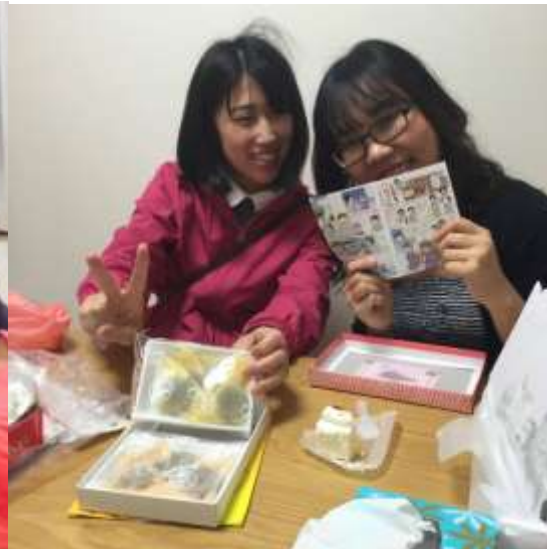
ภาพถ่ายกับรูมเมท☺