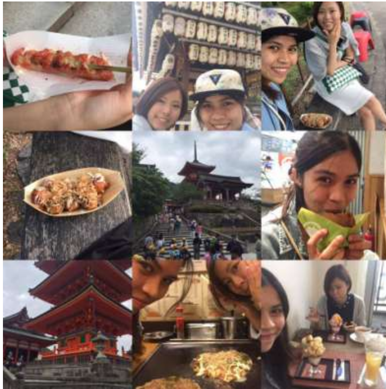
ภาพตอนไปเที่ยวเกียวโตกับบัดดี้