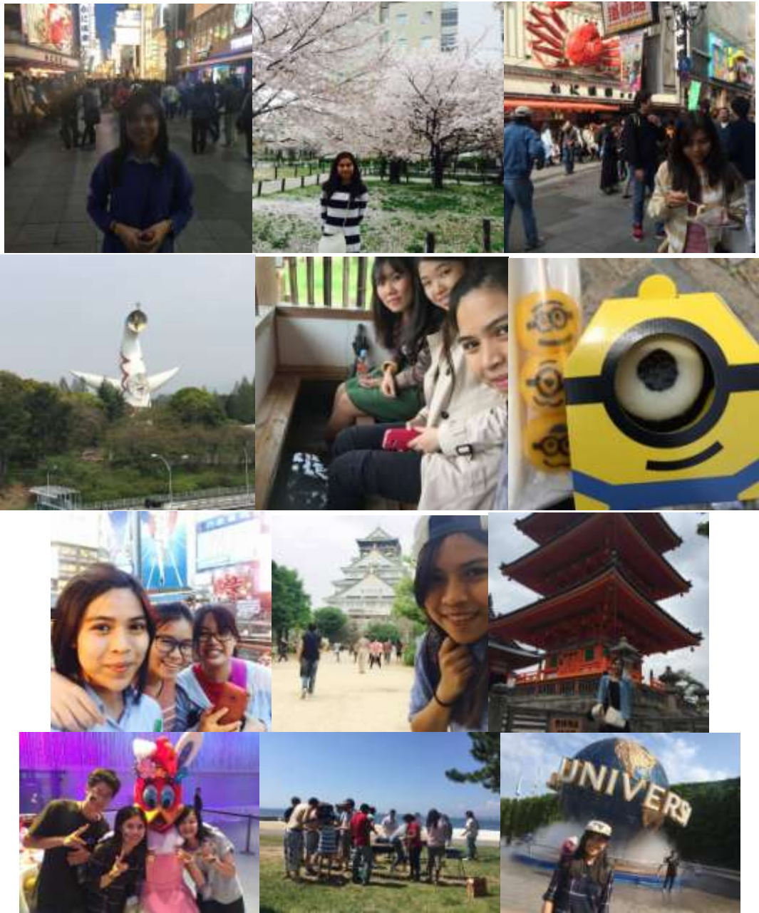
ภาพถ่ายเก็บตกค่ะ ☺☺☺