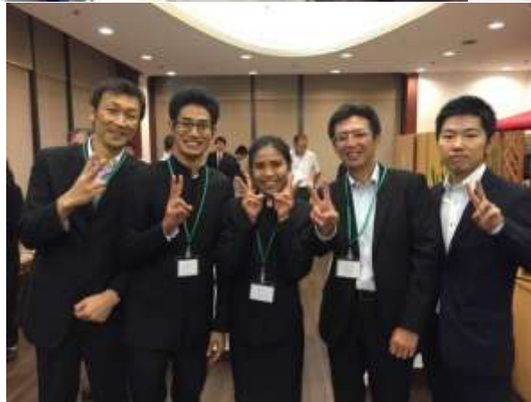
ภาพถ่ายกับคนในบริษัท Sansuisha บริษัทที่ไปฝึกงาน

ช่วงสัปดาห์แรกของการฝึกงานที่บริษัทเขาสอนทุกอย่างเกี่ยวกับโรงงานทั้งคำศัพท์เฉพาะวิธีใช้การโรงอาหารวิธีใช้เครื่อง ตอกบัตร การออกกำลังกายตอนเช้ากฎระเบียบต่างๆของโรงงานรวมถึงการทักทายเพื่อนร่วมงานละ