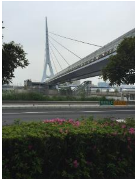
วันนี้ไปโอโดบะไปเจอ ศูนย์โทรทัศน์ฟูจิมาด้วย