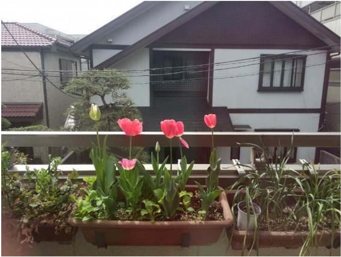
บรรยากาศแถวบ้านไฮสกับห้องนอน (ได้นอนห้องแยกกัน)