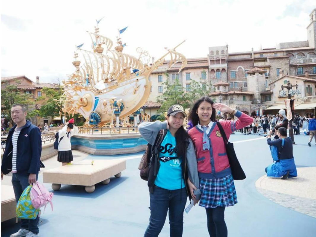
อยากกลับมาเที่ยวอีก มาดิสนีย์เที่ยววันเดียวไม่พอหรอก