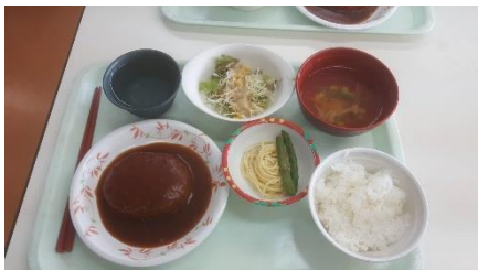
อาหารกลางวันของหอพัก