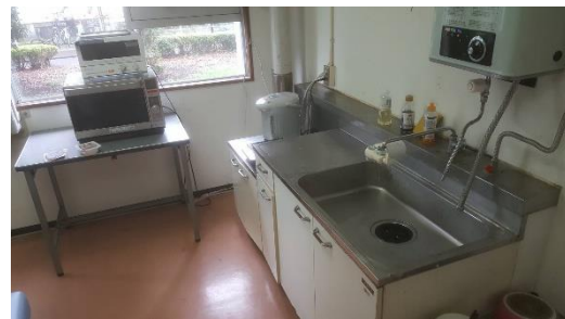
ห้องครัวสำหรับทำอาหาร