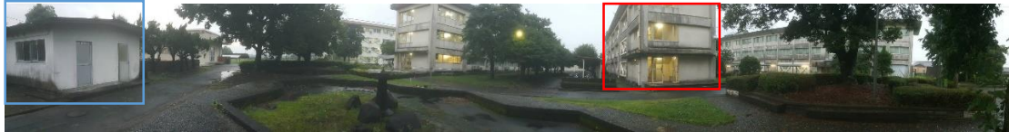
หลังหอพัก

ตึกสีแดงคือหอพักที่อาศัยอยู่ อาคารในกรอบสีน้ำเงินคือห้องสำหรับซักผ้า สามารถซื้อน้ำยาซักผ้าและน้ำยาปรับผ้านุ่มได้ที่ เซเว่นอีเลฟเว่น หรือร้านขายของทั่วไป แนะนำให้ไปซื้อที่ ดองกิโฮเต้ โดยการปั่นจักรยานไป