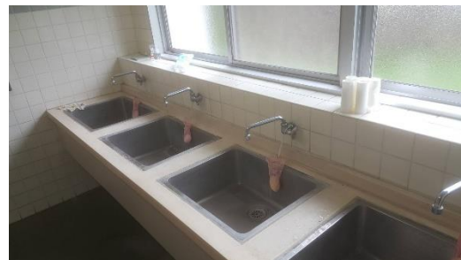
อ่างล้างมือ