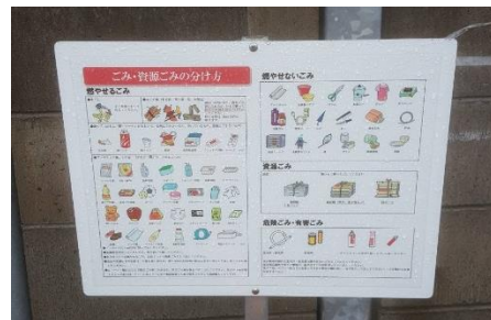
ป้ายแยกขยะ

การซักผ้าสามารถยืมตระกร้าผ้าได้ที่ห้องประชาสัมพันธ์ และสอบถามวิธีใช้เครื่องซักผ้าและเครื่องอบผ้าได้จากคนญี่ปุ่น ใช้งานไม่ยาก