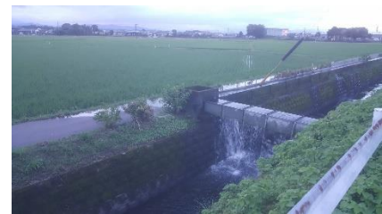
พื้นที่ด้านหลังมหาวิทยาลัย สามารถเล่นได้อากาศดีมาก

กิจวัตรประจำวันค่อนข้างเหมือนกันทุกวัน เวลาว่างสามารถขี่จักรยานได้ที่หน้าเคาน์เตอร์ประชาสัมพันธ์หน้าหอพักเพื่อปั่นออกไปกินข้าว ซื้อของ หรือ เที่ยวได้