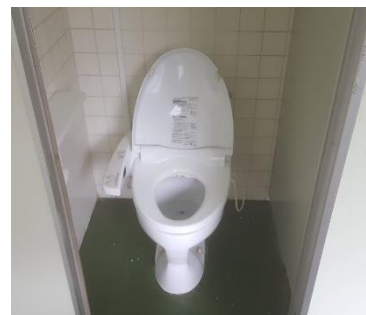
ชักโครกญี่ปุ่น

ถ้าไม่อยากใช้ห้องอาบน้ำรวมสามารถไปใช้ห้องอาบน้ำชาวมองโกเลียได้ที่หลังหอพัก