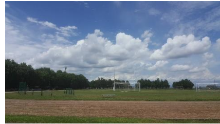
สนามกีฬาของมหาวิทยาลัย

ทางหอพักมีอาหารให้รับประทาน 3 มื้อเฉลี่ยมื้อละประมาณ 330 เยน โดยสามารถไปรับประทานได้ที่โรงอาหารของหอพัก หรือสามารถทำอาหารทานเองได้