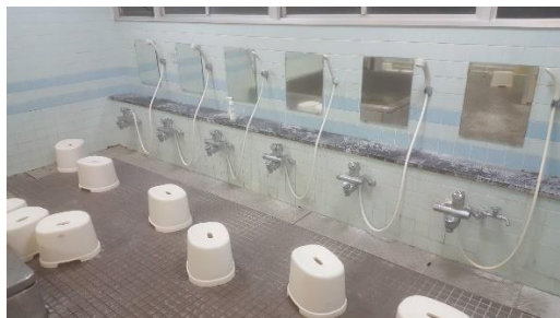
ห้องอาบน้ำ