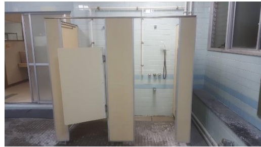
ห้องอาบน้ำ